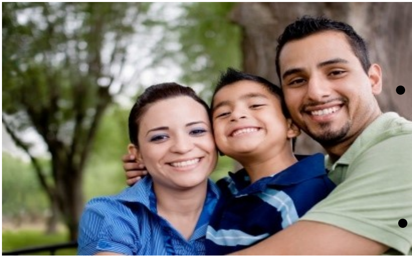
Familia después de Consejería Cristiana